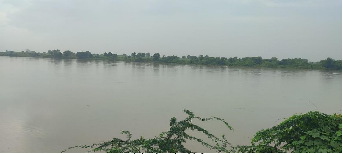
धारासूर येथील गोदावरी नदीचे विशाल पात्र