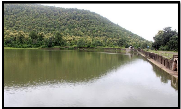
रेणुका माता मंदीर जलकुंड