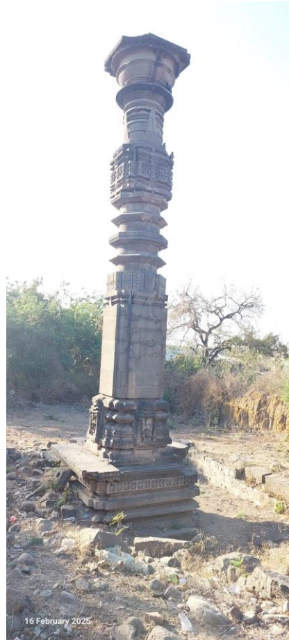
चारठाणा येथील प्रसिद्ध दीपमाळ (मानस्तंभ)