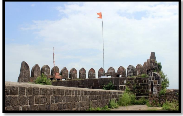
अनुसया माता शिखर माहुरगड