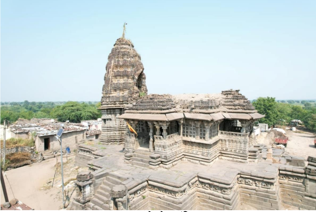
धारासूरचे गुप्तेश्वर मंदिर