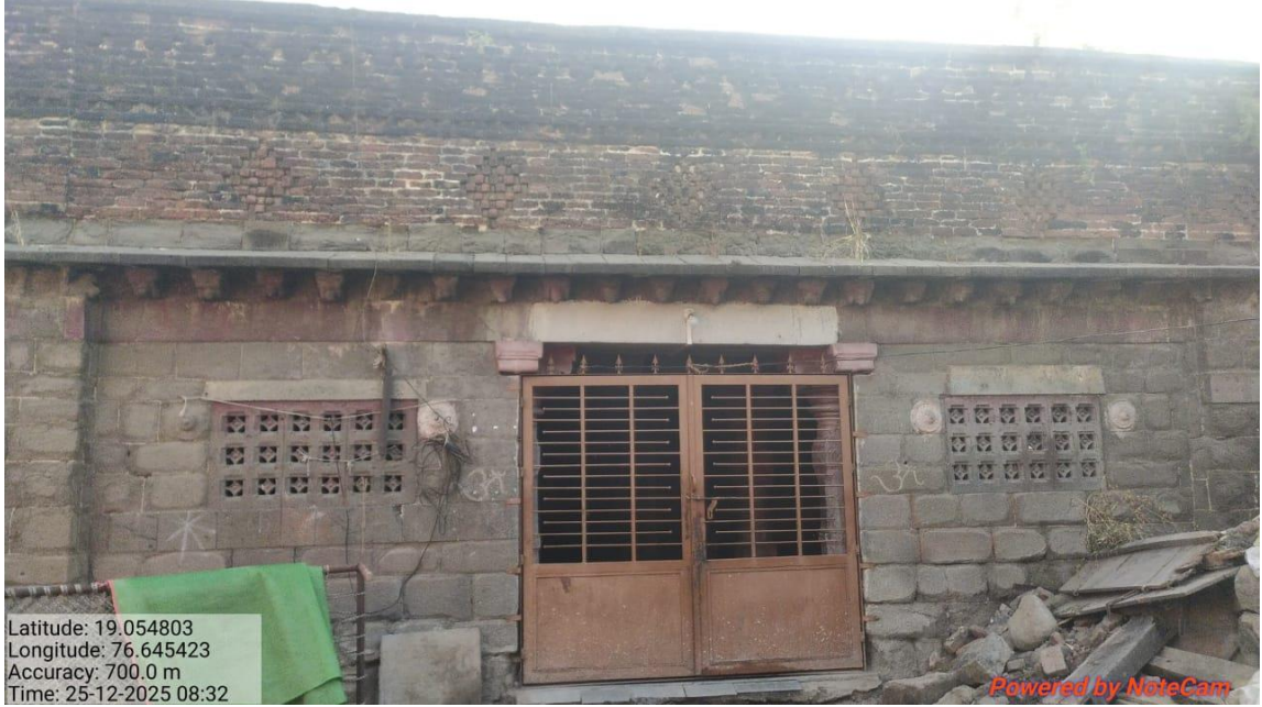
धारासूर येथील केशवराज मंदिर व मूर्ती