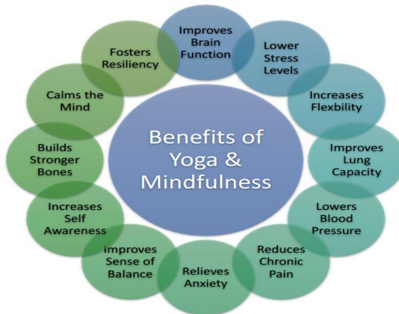
Fig-1 Impacts of yoga for mental health

consciousness. Every action, be it a thought, word or deed, should be done with perspective awareness so that it does not cause pain to oneself or others, now or in the future, to body or mind. Physical and mental health is important for a happy and successful life.